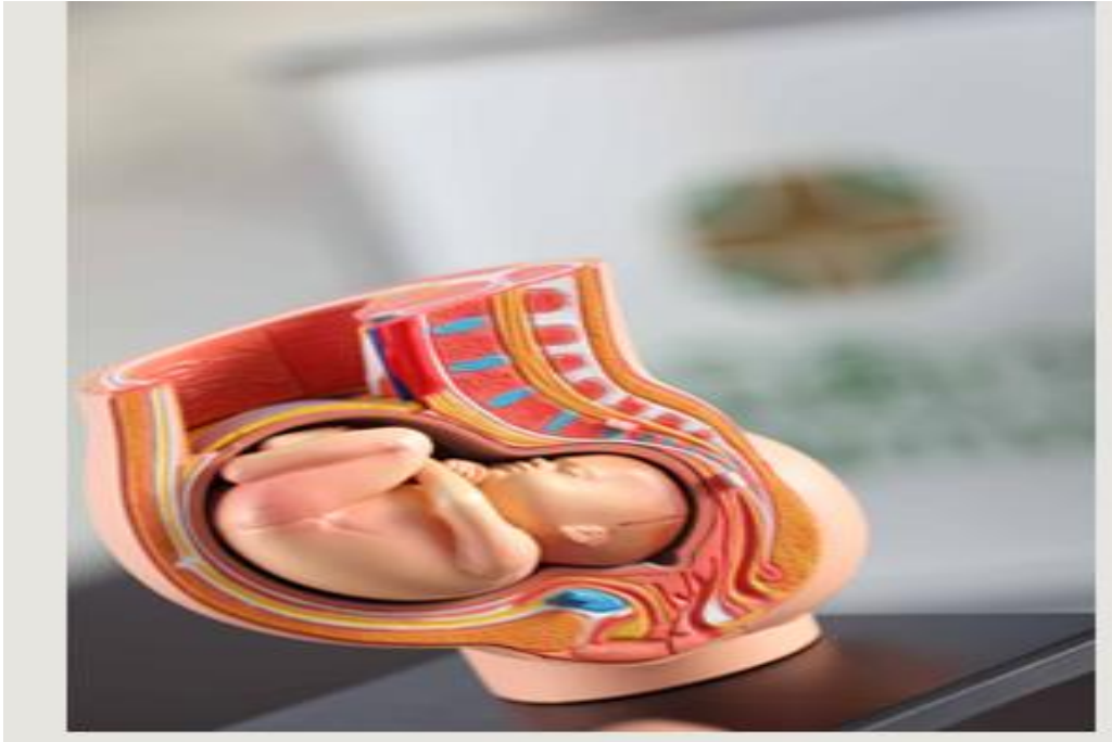
รูปที่ 3 ทารกในครรภ์

หมายเหตุ. ✓ จาก ชื่อหนังสือ (หน้า), ✓ โดย ชื่อผู้เขียน , ✓ ปีที่พิมพ์, ✓ โรงพิมพ์ หรือสำนักพิมพ์. ชื่อหนังสือ ใช้ตัวเอียง