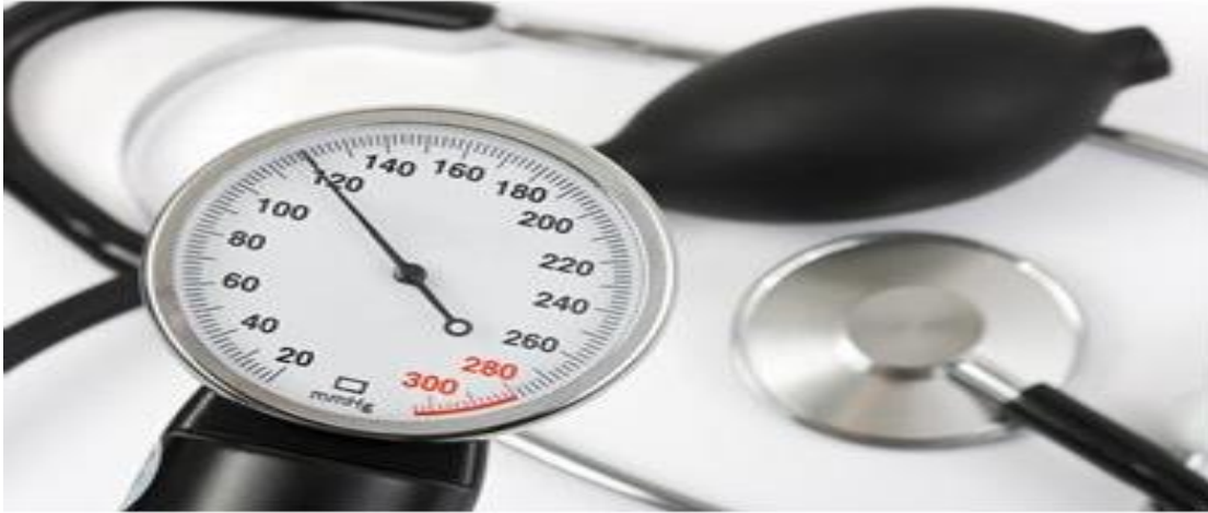
รูปที่ 2 ความดันโลหิตสูง

หมายเหตุ. ✓ จาก “ชื่อเรื่อง,” ✓ โดย ชื่อผู้เขียน, ✓ ปีพิมพ์, ✓ ชื่อวารสาร, ✓ ปีที่(ฉบับที่), ✓ หน้า. ชื่อวารสาร และปีที่ ใช้ตัวเอียง